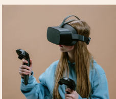
RÉALITÉ VIRUTELLE GRANDE DISTRIBUTION