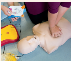
SENSIBILISATION AUX PREMIERS SECOURS